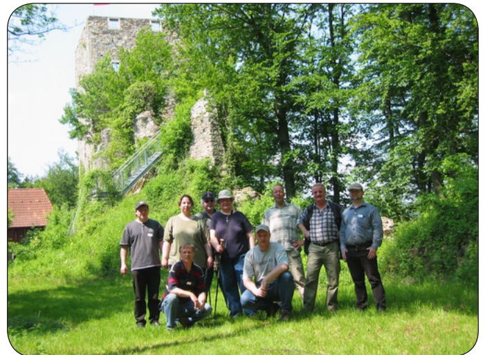
Gruppenbild der Exkursionsteilnehmer auf Burg Haichenbach an der Donau

schlosses Marsbach , um danach zur Burg Ruine Haichenbach aufzubrechen. Hoch über der Donauschlinge gelegen und auf fast ebenen Wanderweg von der Hochfläche aus zu erreichen, wurde die Ruine Haichenbach nach wenigen Minuten erreicht. Atemberaubend war der Blick vom Turm der Ruine auf „zweimal Donau“. Auf der Burg wurde auch das obligatorische Gruppenfoto der Exkursionsteilnehmer (s.u.) gemacht: Nach der Besichtigung der Burg ging es zurück zu den Pkws.