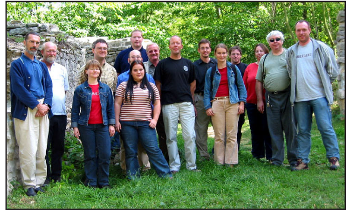
Gruppenfoto der Exkursionsteilnehmer auf Burg Ehrenstein (Thüringen)

Höhlenburg Buchfart, Stadtmauer Stadtilm, Burg Tannroda, Oberschloss Kranichfeld, Burg Ehrenstein, Schlossruine Gehren, Elgersburg, Burg Liebenstein, Ehrenburg