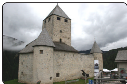
Burg Thurn (Gader)

Durch das sehr romantische Gadertal ging unsere Fahrt weiter zur hochgelegenen Burg Thurn an der Gader . Mit sehr gewöhnungsbedürftigen Zubauten befindet sich