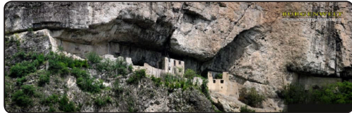
Höhlenburg St. Gottardo

Nachdem die großartige Burg Belfort vollständig erkundet war, verließen wir das Nonstal (Trentino) und begaben uns wieder in Richtung Südtirol. Mit einem kurzen Blick vom Weiten zur Höhlenburgruine St. Gottardo , zu der wir leider den Aufstieg nicht fanden, ging es weiter zur Außenbesichtigung des Castel Monreale .