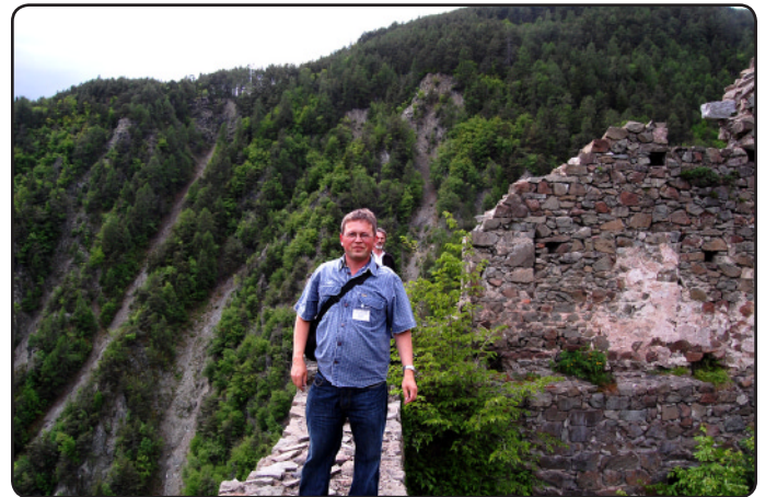
Exkursionsteilnehmer auf Burg Stein